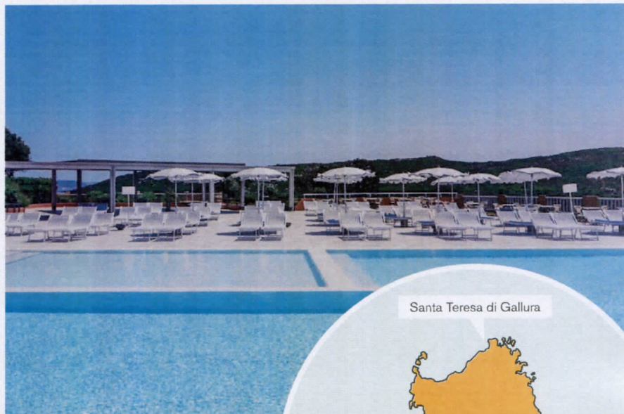
Santa Teresa di Gallura